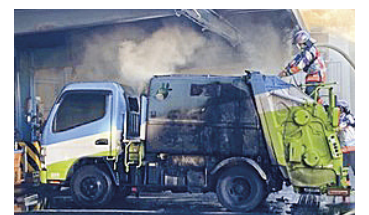
京都市のごみ収集車の火災被害状況