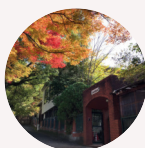
岩屋こども園 アカンパニ 園長 室田先生