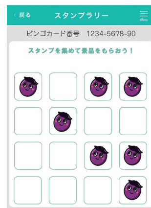
※ビンゴのイメージ