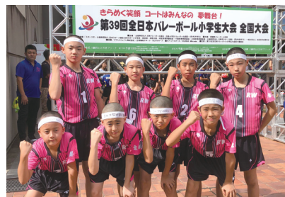
陵ヶ岡スポーツ少年団