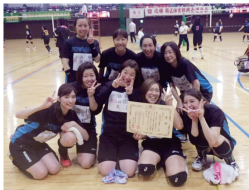
音羽川体振チーム

8月25日、ハンナリーズアリーナ・京都市市民スポーツ会館で京都市バレーボール祭が開催されました。山科区からは4学区から4チームが参加し、七条(下京区)と滋野(上京区)の2チームに勝利した音羽川体振チームが見事「優秀チーム」に輝きました。残りの3チームも、他の行政区の強豪と熱戦をくりひろげ、大いに健闘しました。