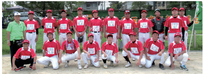
山階南体振チーム

体振チームが、準決勝で強豪チームの嵐山東(西京区)と対戦しました。山階南体振チームは、失点を防ぎつつ着実に得点を重ね、決勝戦出場の切符を手にしました。