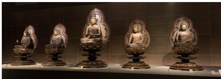
写真:今回国宝に指定された「五智如来坐像」 左から不空成就、阿弥陀、大日、宝生、阿閼の各如来像

長らく国の重要文化財だった安祥寺「五智如来坐像」。今年3月、国の文化審議会にて国宝指定の答申がなされました。近年の調査や研究の進展で、その歴史的価値が評価され、国宝指定の運びとなりました。