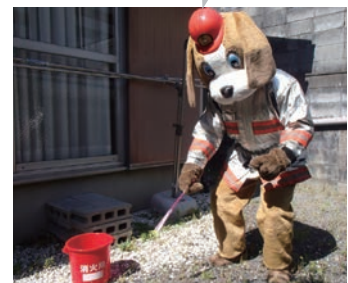
山科消防署 キャラクターイヌ隊長