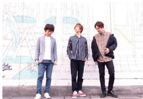
山科出身の兄弟ユニット 「イーワイエス」