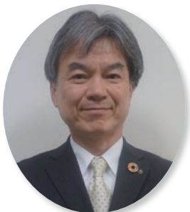
山科区長 吉川雅則

このたび、山科区長に就任しました吉川雅則です。 山科は、1400年を超える歴史と豊かな自然に恵まれ、 人と人のつながりがとても温かいまちです。