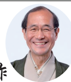
京都市長 門川 大作