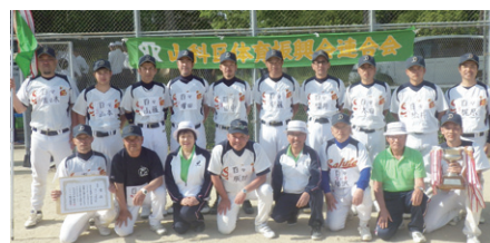
昨年度、京都市大会の頂点に輝いた百々体振チームが2年連続8回目の優勝!!

5月7日に第41回山科区民ソフトボール大会が勸修寺公園グラウンドで開催されました。今回は昨年度より1学区増え、11学区の体育振興会チームが出場し、熱戦が繰り広げられました。