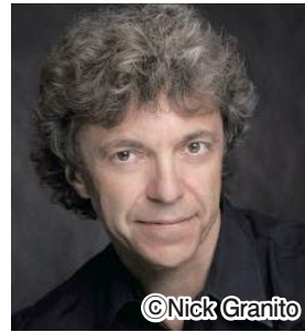
パスカル・ロジェ

京都市交響楽団創立60周年を記念し、「第608回定期演奏会」(指揮：下野竜也、ピアノ：パスカル・ロジェ、曲目：モーツァルト「ピアノ協奏曲第25番ハ長調」他)に区民の皆様をご招待します。