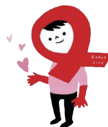
京都市 HIV マスコット 「あかりん」