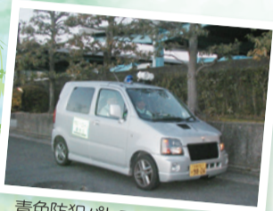
青色防犯パトロール車

「世界一安心安全・おもてなしのまち京都 市民ぐるみ推進運動」 山科区推進協議会(区まちづくり推進担当 ☎592-3088)