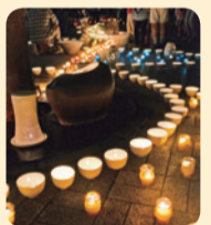
やましな駅前陶灯路

山科地域の潜在的な観光資源の掘り起こし、磨き上げを行い、山科地域の観光まちづくりを推進します。