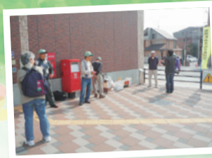
安否確認も兼ねた天ぷら油の回収