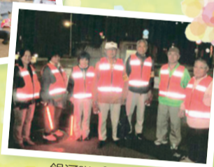
銀河隊パトロール