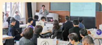
山科“きずな”支援事業活動報告会