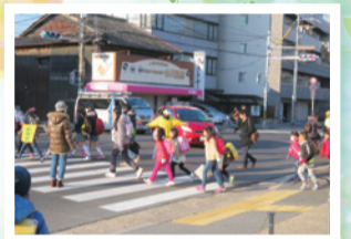
登下校時の子ども見守り活動