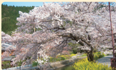
東山自然緑地の桜

トイレやジョギングコースの改修などを行い、快適に四季の花木を楽しむ散策路としての魅力向上を図ります。