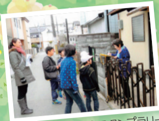
こども110番のいえスタンプラリー