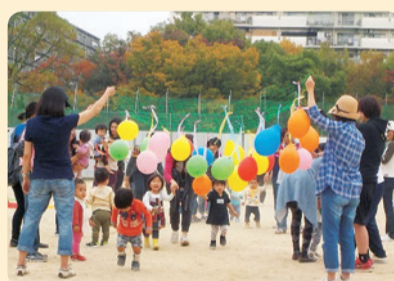
やましなっこひろば