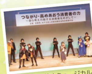
振り込め詐欺防止ミュージカル