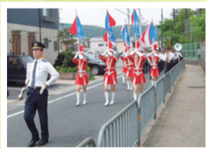
交通安全・防火・防犯パレード