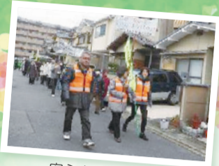
安心安全パレード