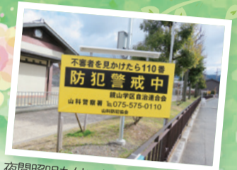
夜間照明も付いた大型防犯プレート