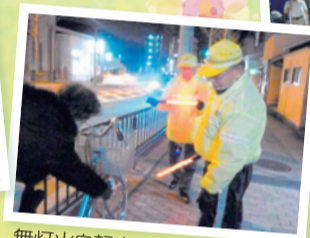
無灯火自転車に対する注意喚起