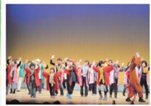
振り込め詐欺防止の寸劇