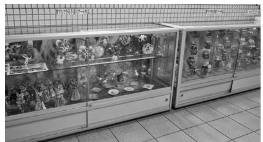
ショーケースタイプ