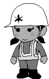
京都市土木事務所 イメージキャラクター セツちゃん