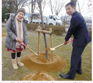
募金者等による土かけの様子

山科区民花の回廊募金でヤマザクラを植樹しました 山科区を様々な花で自然豊かな潤いのあるまちにしたいことを目的に実施する「山科区民花の回廊募金」では、平成25年度に引き続き、東山自然緑地山科疏水公園にヤマザクラを植樹しました。 今後は、山科区が花と緑に彩られて美しいまちになるよう取り組んでまいりますので、皆さんの募金へのご協力をお願いします。 申し込み方法 / 募金を添えて、お問い合わせ先へお越しください。 問い合わせ先 / 区まちづくり推進担当 (☎802-3008)