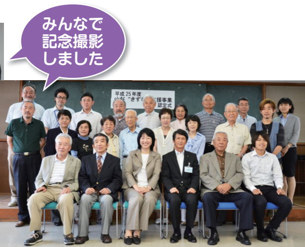
(新規事業のみなさん)