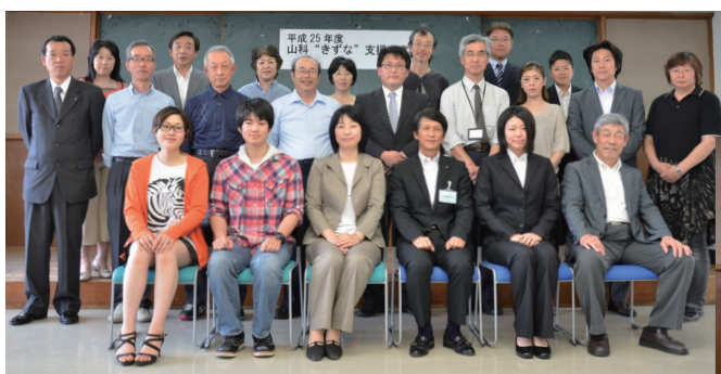
(継続事業のみなさん)