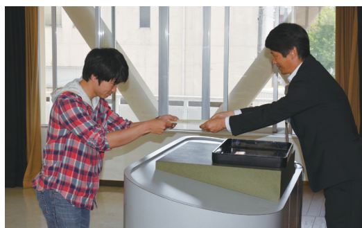
認定式での認定証授与の様子

山科区では、第2期山科区基本計画が目指す「心豊かな人と緑の“きずな”のまち山科」の実現に向けて、区民の皆様による主体的なまちづくり事業を支援するため、補助金を交付する「山科“きずな”支援事業」を実施しています。