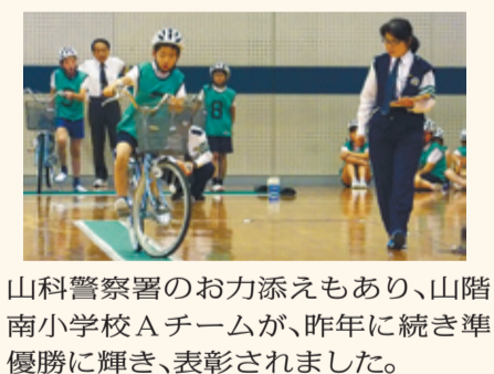
山科警察署のお力添えもあり、山階南小学校Aチームが、昨年に続き準優勝に輝き、表彰されました。

中高生向け 夏休みフリータイム夏休みにもスポーツルームを開放 随7月25日(木)～8月25日(日)15:00～18:00。場当センター。場市内に在住もしくは通学している中高生年代。費無料。☎不要。