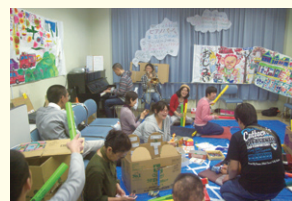
2011年やませいまつりでの公演「電車カフェ」

成19年を初舞台に、毎年新たな作品を作り出しています。ともすれば支援される側になりがちな障害者が、このプロジェクトの中では絵やダンス・演技など自分の得意な活動を活かして、表現者の一員として活躍します。