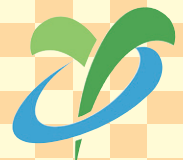
山科区シンボルマーク