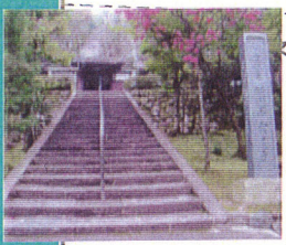
4 「大石神社」 クスノキ 大石良雄隠棲の地