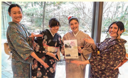
留学生とボランティアの和装体験の様子

資格や経験がない方でも、日本語学習や子育て支援、京都の魅力発信など、さまざまな分野で活躍できます。