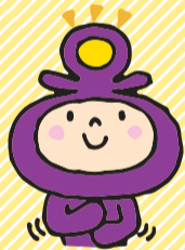
市広報マスコット ミック

市政協力委員は、市民主体のまちづくりに欠かせない存在。委員の仕事に加え、地域での顔の見えるつながり作りも行っているんですよ。