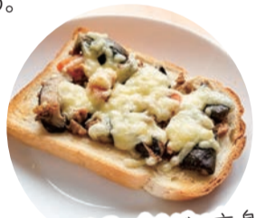
麻婆茄子がピザに変身!

例えば、炒め物は、パンに乗せてチーズをかければピザに変身! 思わぬところから美味しい創作料理が生まれるかもしれません。