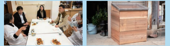
京北めぐる市〜くろもじスイーツ教室 生ごみ分解装置のDIYワークショップ