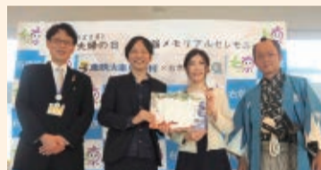
↑隊士、区長と園田夫妻で記念撮影