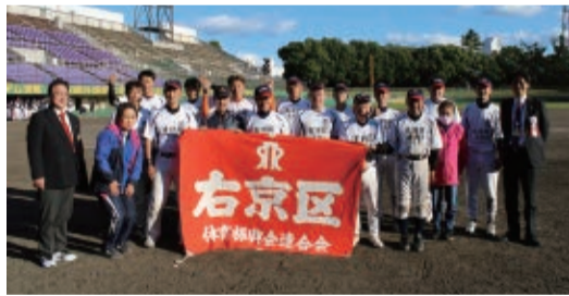
北梅津体振の皆さん

11月3日、2年ぶりに西京極総合運動公園と葛野小学校にて開催されました。壮年ソフトボール大会では、北梅津体振が優勝の栄誉に輝きました。その他のチームも優秀な成績をおさめました。