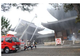
昨年1月の妙心寺での訓練

「文化財防火運動」を実施します! 1月23日~29日 昨年10月、首里城が全焼したニュースには、大きな衝撃を受けられたことと思います。 昭和24年1月26日に奈良県法隆寺金堂の国宝の壁画が、火災により焼損したことを契機に「文化財防火デー」が定められました。 京都市では、この日を含む1週間に「文化財防火運動」を展開しています。 運動期間中、近隣の住民等で組織されている「文化財市民レスキュー」の皆さんや消防団とも連携した合同消防訓練を実施するなど、防火体制の強化に取り組めます。 これまでの歴史を見ても火災が原因で多くの文化財が失われています。先人が守ってきた、かけがえのない文化財を後世に伝えるため、地域ぐるみで火災を防ぎましょう。 問合せ 右京消防署 ☎871・0119