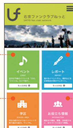
サイトのトップページ画面 (スマートフォンの場合)

「住んでる学区のこと実はあんまり知らないな…」と思ったらココへ! 学区の紹介だけでなく、イベントや取り組みなども紹介していきます。