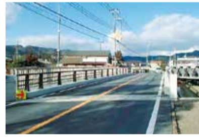
架け替え後の鳴瀧橋

鳴瀧橋の供用を開始しました! 平成25年9月の台風18号の豪雨に伴い落橋し、仮橋により対応してきた国道10号「鳴瀧橋」が新たに架け替えられ、1月28日(木)に供用を開始しました。 土木管理部橋りょう健全推進課 ☎222-3561