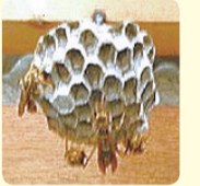
アシナガバチの巣

灰色で、お椀を逆さにしたような形で多くの巣穴が見えます。アシナガバチは攻撃性が低いので、巣の場所によってはそのまましておくケースが多いようです。駆除はご自身でしてください。