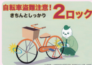
ポスターデザイン：京都嵯峨芸術大学短期大学部 美術学科デザイン分野 池田遙香氏 作