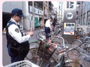
西院地域における放置自転車対策