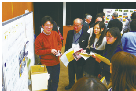
*当日の会議の様子を、動画(YouTube)で配信しています(区役所ホームページからもリンクあり)。

後半の「来年度事業案お披露目会」では、9つの事業案のブースを回遊し、意見やアイデアを交換。「うちの事業とコラボしたい」、「一緒に対策を考えたい」といったアイデアが次々と飛び出し、活発な議論が飛び交いました。事業への協力者や、参加者からいただいた意見やアイデアはまちづくりの種を育てる大きな力となることでしょう。