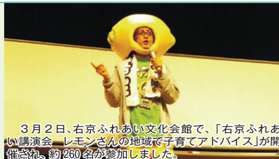
3月2日、右京ふれあい文化会館で、「右京ふれあい講演会 レモンさんの地域で子育てアドバイス」が開催され、約260名が参加しました。