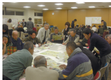
マップの最終チェックを行う全体会議の様子

これまで地域住民の方々と会議を重ね、各学区まち歩きイベントを開催することで、地域住民同士のつながり、地