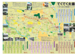
地域力推進室にて配布

地域住民にとっても使いやすい、来訪者にとっても楽しいルートや地域情報を掲載した地域の魅力がいっぱい詰まったマップです。