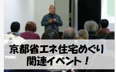
京都省エネ住宅めぐり 関連イベント！

参加費: 無料 申込方法: お電話または申込フォームにてお申込みください。(先着順・申込要) 申込期間: 6月15日(月)～7月3日(金) / 申込先 ☎(京都市住宅政策課企画担当):075-222-3666 申込事項: 申込者名、電話番号、住所、参加人数、参加回、情報入手先 主催: 京都市