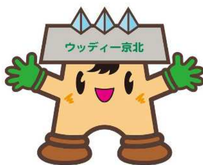
ウッディー 京北マスコットキャラクター (ウッディーくん)