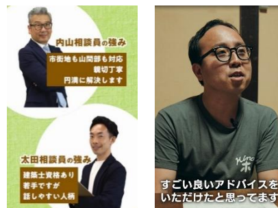
空き家相談員制度等の紹介動画