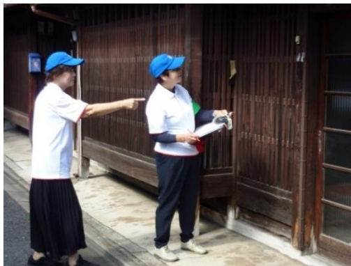
＜まち歩き・空き家調査＞

地域主体の空き家対策に計223学区（令和6年度末時点）で取り組んでいただいております、各地域団体において、おしかけ講座の受講、まち歩きによる空き家調査、空き家マップの作成、空き家所有者向け相談会、空き家所有者への活用提案など、様々な地域主体の空き家対策が展開されています。