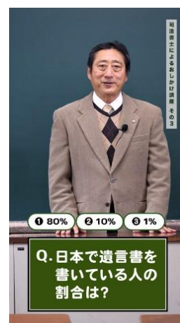
ウェブサイト「京都市空き家対策室/Kyoto Dig Home Project」 空き家化予防に関する動画