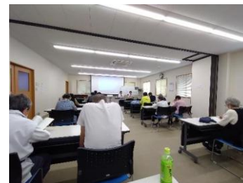
＜おしかけ講座の様子＞