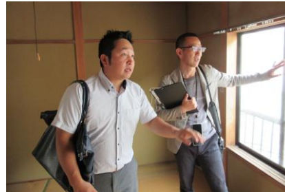
＜専門家派遣制度の様子＞

地域主体の空き家対策に計223学区（令和6年度末時点）で取り組んでいただいております、各地域団体において、おしかけ講座の受講、まち歩きによる空き家調査、空き家マップの作成、空き家所有者向け相談会、空き家所有者への活用提案など、様々な地域主体の空き家対策が展開されています。