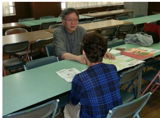
＜空き家に関するワークショップ＞

まちづくり活動の一環として、空き家対策に取り組む地域団体を対象に、専門家の紹介や活動費補助等の支援を行っています。（令和4年度から新規学区の募集は休止）