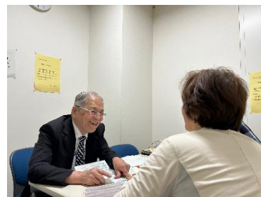
＜地域の空き家相談員による相談会の様子＞

※ 新型コロナウイルスの影響により、令和2年4月から7月まで相談会を休止。8月から12月までは代替措置として市役所、オンラインにて開催（うち市役所29組、オンライン6組）。令和3年1月から各区役所・支所にて再開。