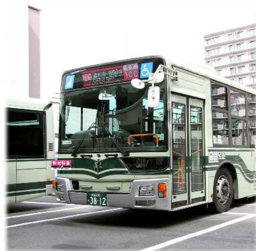
「観光特急バス」の新設など観光系統の再編 (※画像はイメージです)

市バスと京都バスで重複している系統番号の一部解消を図るほか、一部停留所の名称を分かりやすいものに変更します。