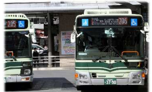
市内中心部の循環系統・幹線系統の増便 (京都駅前Dのりば)