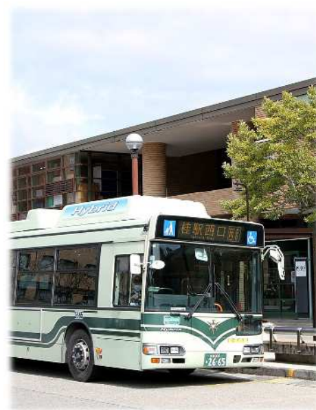
洛西地域のまちづくりと連携した運行の見直し (洛西バスターミナル)