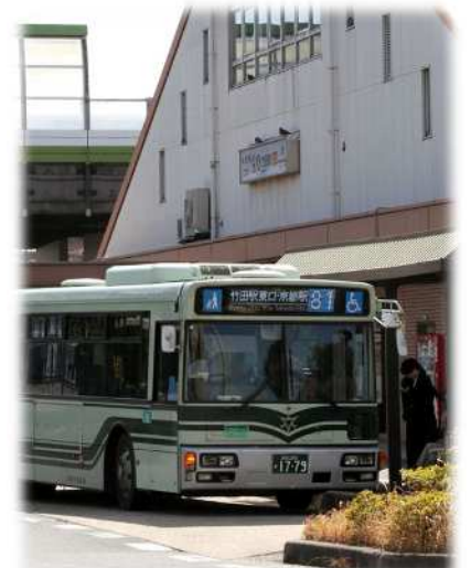
鉄道駅への接続など系統の新設・運行ダイヤの充実 (竹田駅東口)

地下鉄をはじめ、鉄道駅を経由する運行を拡充するとともに、鉄道とスムーズに乗継できるダイヤ編成を進めます。