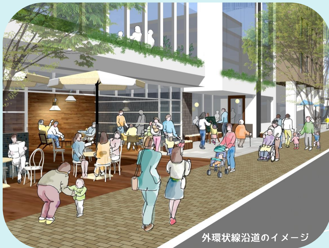
外環状線沿道のイメージ