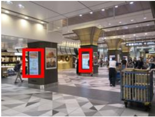
【J・AD ビジョン Central 東京駅八重洲北】