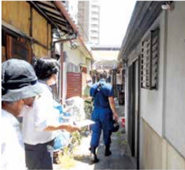
毎年開催！ 防災まちあるき