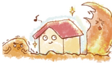
耐震・防火改修で 住まいを安全に！