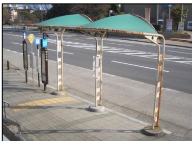
平成22年バス停留所改修前