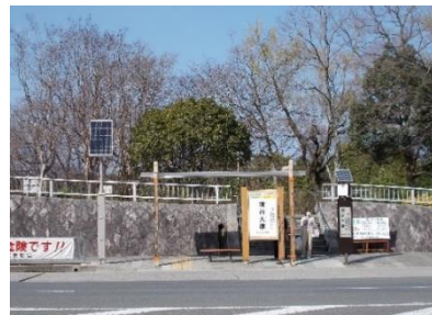
現在のバス停留所改修後