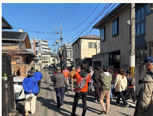
防災まちあるきと 意見交換会に参加

今回は紫野学区におじゃまし、どんなコトに取り組んでいるのかを調べてきました。紫野学区では、防災まちあるきで防災の豆知識を参加者に伝えたり、総合防災訓練で子ども向けのコーナーを出展したりしているようです。