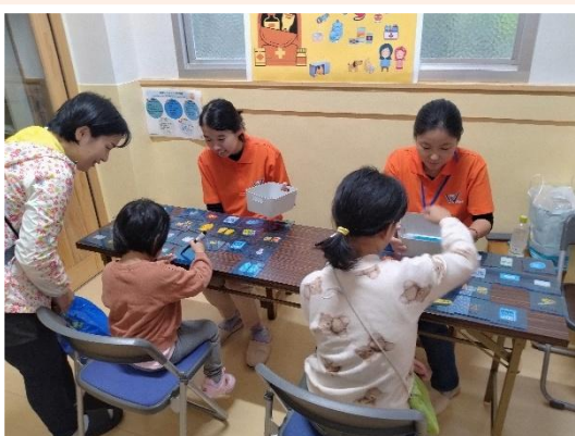
子ども向けのコーナー (総合防災訓練)