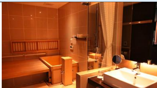
つぼ渦404(バリアフリールーム)の水廻り