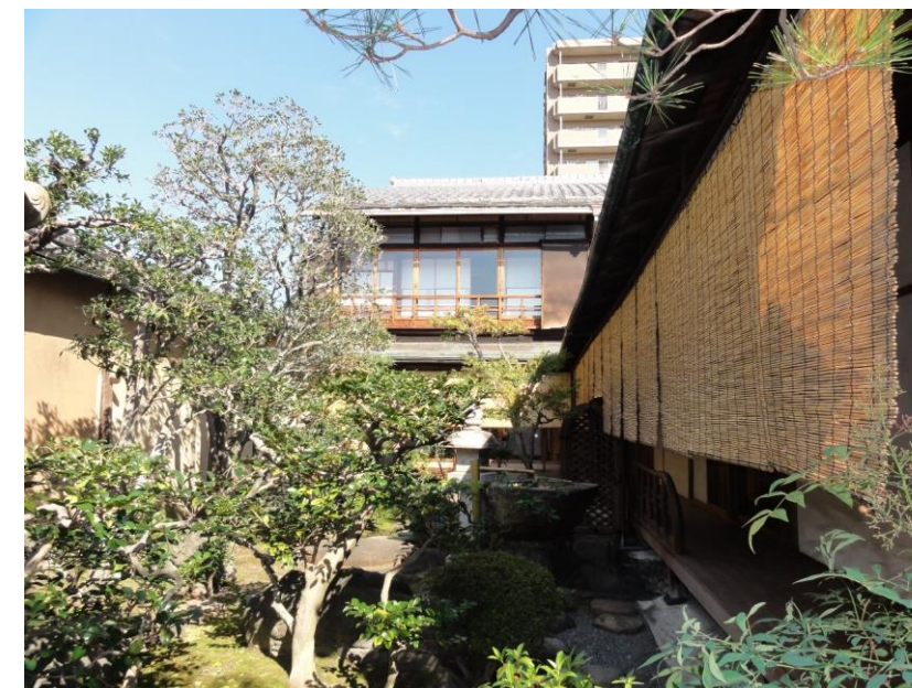
③ 主屋外観（中庭側から）