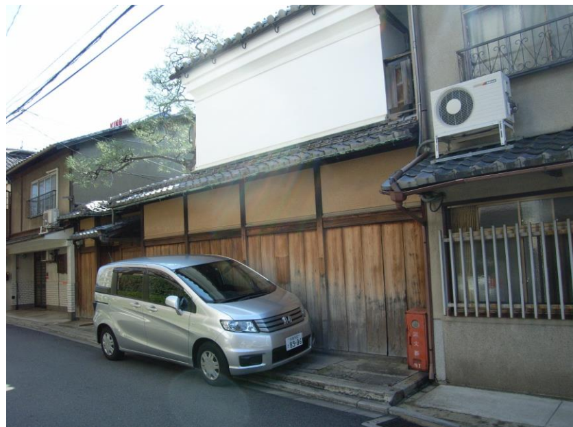
② 周辺地域（〇〇通から東を見る）