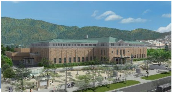
京都市美術館再整備後の北西鳥瞰図