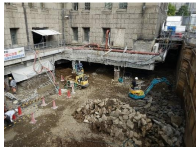
免震改修工事の状況