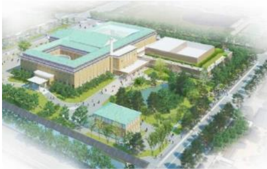
京都市美術館再整備事業の南東鳥瞰図