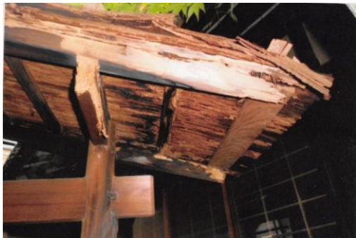
改修前(前庭にある門扉)