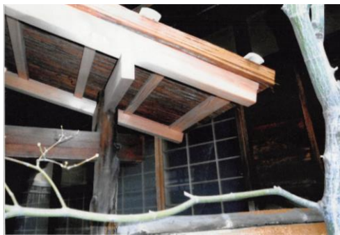
改修後(前庭にある門扉)