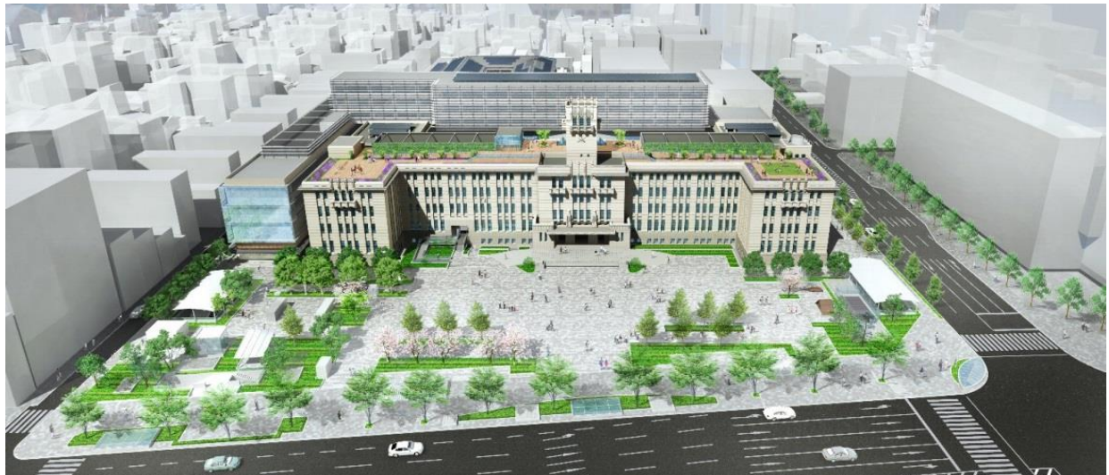
整備後のイメージパース