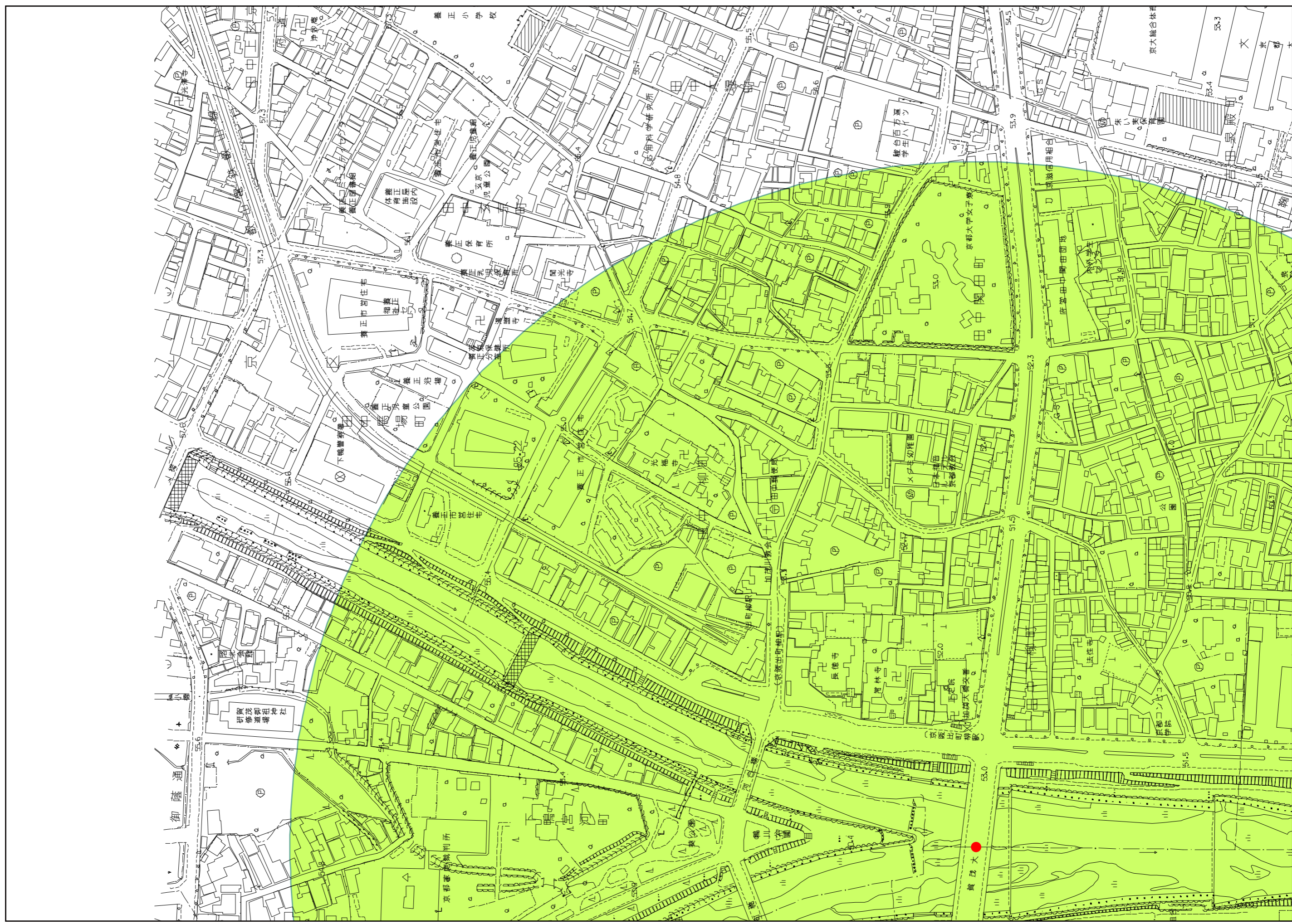
(47) 鴨川に架かる橋からの鴨川