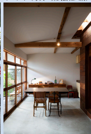
柳沢究：紫野の町家改修