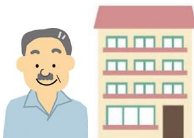
賃貸住宅のオーナー等