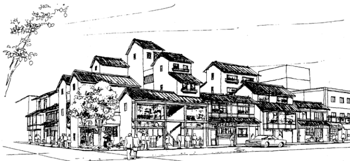
（町家型共同住宅モデル設計のイメージスケッチ）