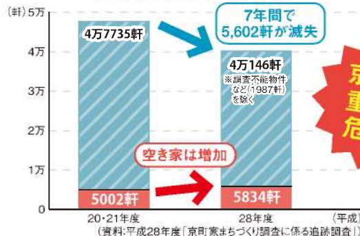
【京都市における京町家の数】

所有者の方々だけでなく、みんなの問題として、 京都の貴重な財産である京町家を守り、次の世代に引き継いでいきましょう!