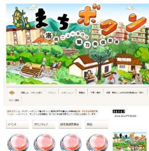
● 洛西ニュータウン創生推進連絡会ホームページ