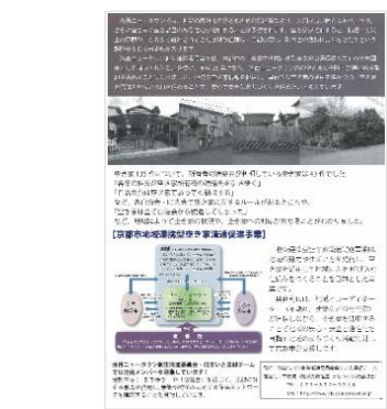
● 空き家調査に関するニュースレター