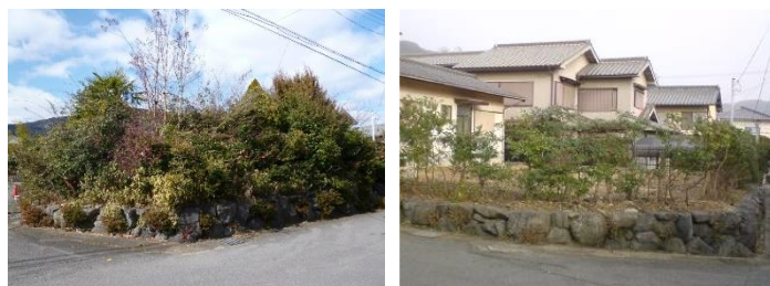
● 調査活動後の変化の一例（左が調査前、右が調査後）