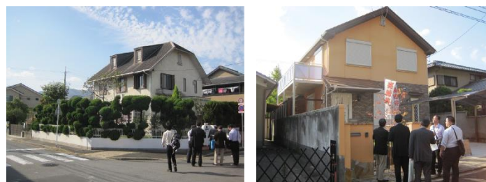
● 外観調査・まちあるきの様子（平成 23 年 11 月）