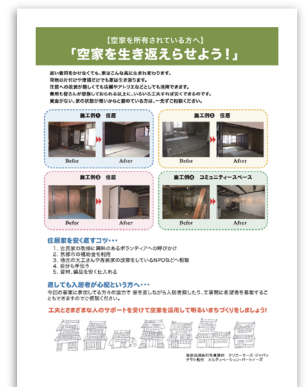
● 取組 PR チラシ