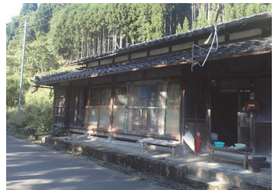
● 田舎暮らし体験住宅