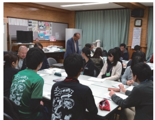
● 移住促進活動（大学生とパンフレット作成）