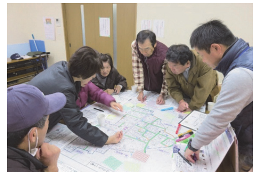
● 災害図上訓練の様子