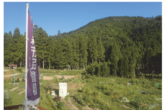
● 大森市民農園（貸し農園）