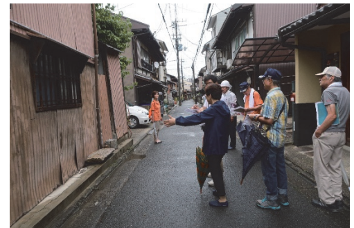
● 防災まちあるきの様子