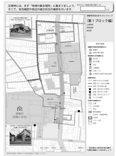
防災まちづくりマップ(第1ブロック版)

いざというときに備え、いま一度、お住まいのまちの状況をご確認いただくとともに、各ご家庭で「防災まちづくりマップ」を大切に保管していただきますよう、お願いいたします！