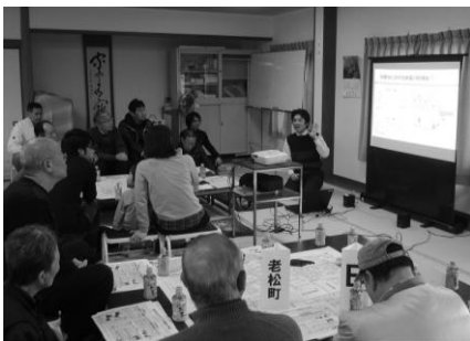
すまいのセミナー