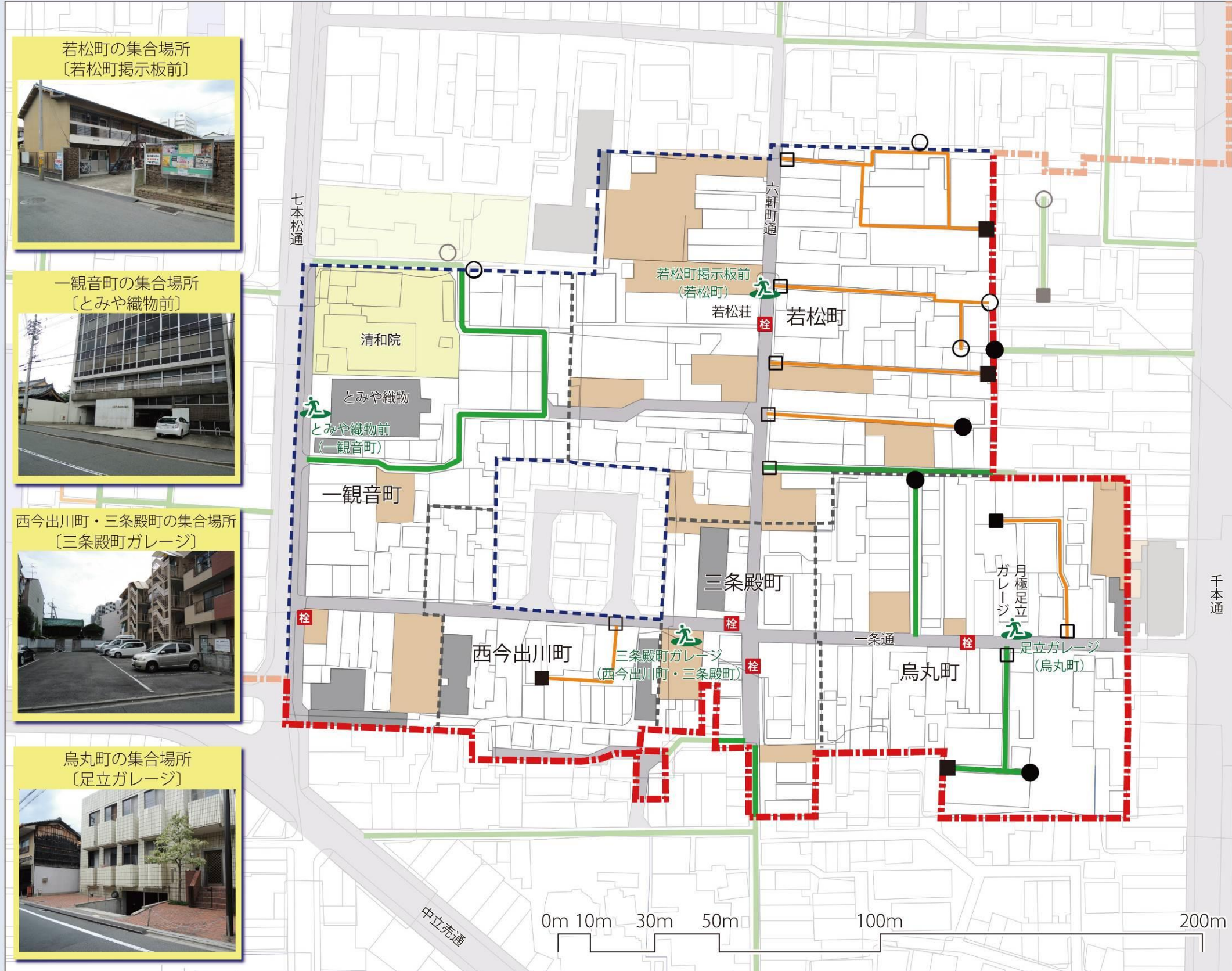
若松町の集合場所 〔若松町掲示板前〕