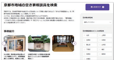
相談員検索ページ